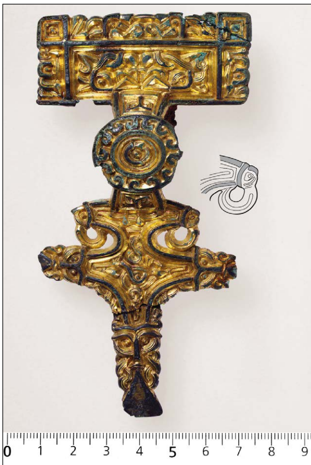
Figur 8.2. Relieffspenne Kvåle. Tegning: Ingvild Tinglum Bøckman, KHM.

Det krumme nebbet og vingen som er lagt om fuglekroppen, er typiske trekk som gjenfinnes på spenner/smykker og skjolddekor i merovingertid (Magnus 1999:163–164; 2002). Fugleformen har likhetstrekk med blant annet skjolddekor fra Sutton Hoo og ikke minst fuglehodene på den berømmelige Åkerspenneren i forgylt sølv. Likevel har fuglen enkelte trekk som virker alderdommelige, og som skiller den noe fra merovingertidstypene. Dette gjelder bl.a. den særegne, litt langtrukne «snabelformen» på nebbet. Dette kan minne om utformingen av bl.a. profilhoder i sen stil I på enkelte relieffspenner, eksempelvis B6516 fra Kvåle i Sogndal kommune, Sogn og Fjordane (figur 8.2). Fugleformete spenner standardiseres dessuten i merovingertid og finnes derfor hovedsakelig i to hovedtyper: Den ene typen er formet som en rovfugl med krummet nebb fremstilt i profil (Ørsnes 1966:type L3, også kalt «Vendelkråka» eller bird-of-prey brooches), mens den andre typen er en fugl med sammenslåtte vinger sett ovenfra. Denne typen benevnes gjerne som