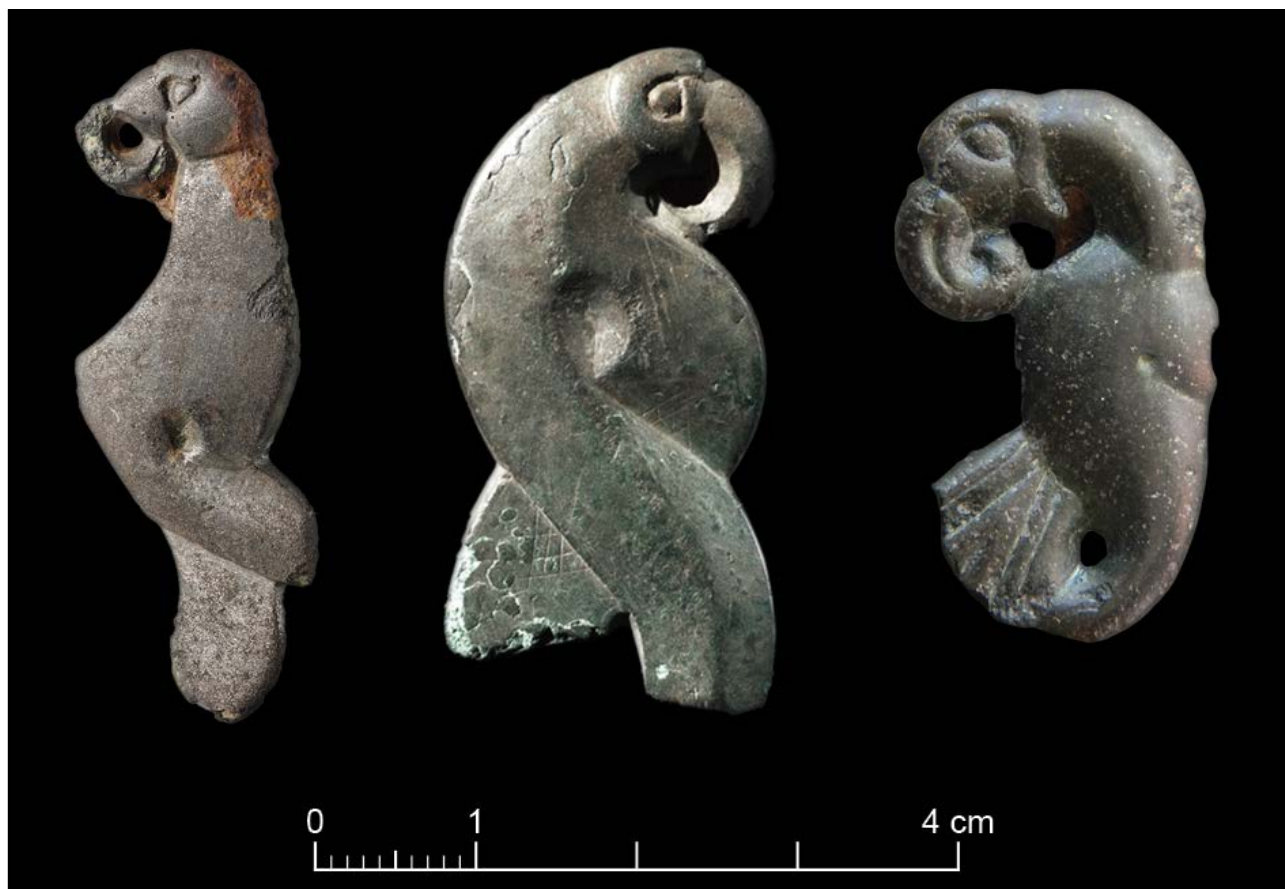
Figur 8.1. Spenner med fugler med markerte øyne og nebb fra (venstre) henholdsvis Rømma, Maridalen og Runsa borg.

Spennen er laget av kobberlegering, og formuttrykket tar utgangspunkt i to plastisk modellerte bånd som danner en fuglekropp med vinge. Disse slynger seg om hverandre og avsluttes i et hode med et markert øye, kraftig øyebryn og krummet nebb. På baksiden er det bevart deler av nålefeste og nåleholder. Nålen mangler, men korrosjonsrester viser at den har vært av jern. Spennen er 4,2 cm lang og veier 6,3 g. Den har klare likhetstrekk i C52837 fra Maridalen i Oslo.