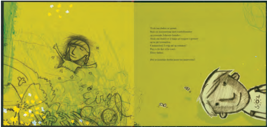
Figur 4: Grønn (oppslag 4 fra Noen sier at døden er svart ). Gjengitt med tillatelse fra Annlæg Auestad/Wigestrand forlag.