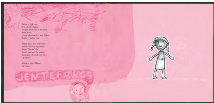
Figur 6: Rosa (oppslag 9 fra Noen sier at døden er svart ).

Alfred har ulike tanker om rosa. På den ene siden er han preget av samfunnets oppfatning av fargen: «Alfred synes rosa er jentete. Barbie! sier han og grøsser. Kjoler! Sløyfer! Æsj.» Men samtidig er han glad i Marie, og hun er jo jente med rosa farger. Han assosierer rosa også med solnedgangen, og solnedgangen kan forbindes med å dø. Derfor slår Alfred fast: «Døden er nok rosa. Som en solnedgang.» Refleksjonene til Alfred viser nettopp at en farge som rosa har et stort meningspotensial, og at den også kan, når han tenker etter, forbindes med døden. I likhet med rød befinner rosa seg i den «varme» enden av fargeskalaen, noe som gjør at dette oppslaget gir en varm og positiv effekt. Døden får igjen en mer positiv framstilling enn slik det første oppslaget viste.