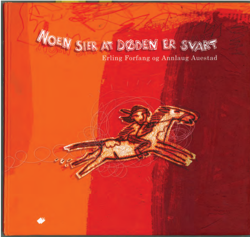
Figur 1: Forsiden til bildeboka Noen sier at døden er svart.

Gjennom boka undersøkes ulike farger på døden gjennom Alfreds refleksjoner og samtalene han har med Maria i tankene sine. Hver farge får ett eller to oppslag, og gjennom verbalspråk og illustrasjoner bruker Alfred dagliglivets erfaringer til å spekulere på hvordan døden kan være.