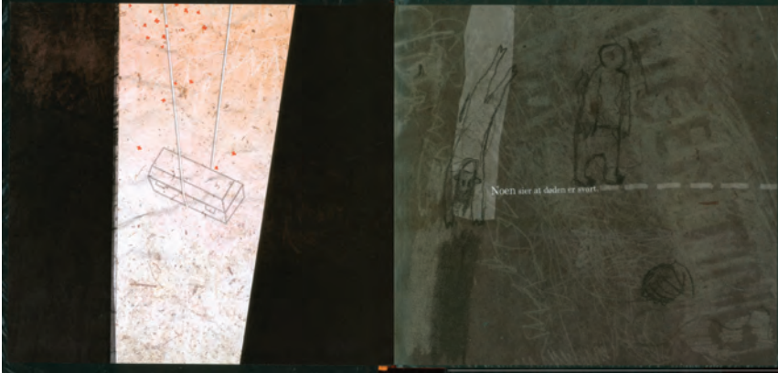
Figur 2: Svart (oppslag 1 fra Noen sier at døden er svart ). Gjengitt med tillatelse fra Annlaug Auestad/Wigestrand forlag.