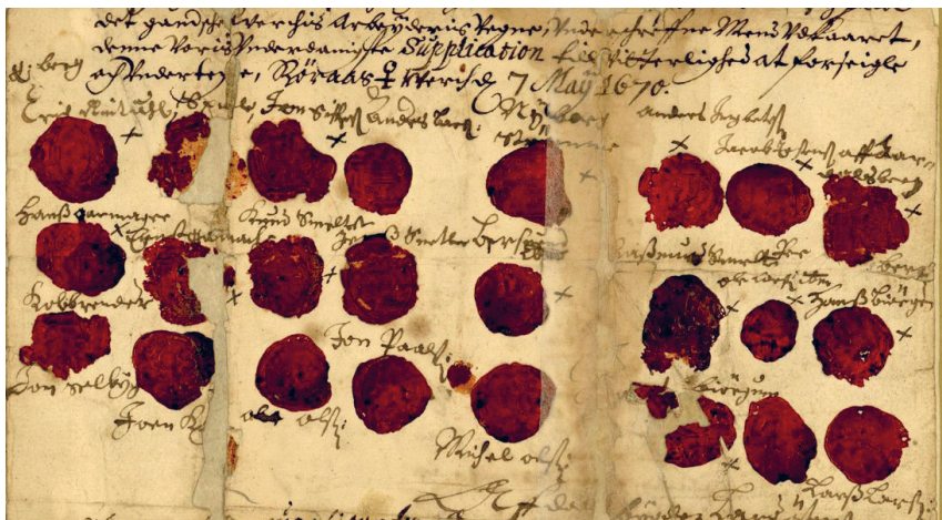
Side 3 av supplikk fra 1670. Underskrevet og med segl av bergarbeidere på Røros.

Smeltearbeiderne jobbet i skift og tilbrakte mer tid på gårdene sine, noe som muligens satte dem i en bedre posisjon enn gruvarbeiderne (Borgos, u.å.). Kjøerne, som transporterte malm, kull og ved for kobberverket, var vanligvis bønder med alternative inntekter. Bigeskjeftene kan kanskje til dels forklare hvorfor partisipantene kunne holde tilbake lønnsutbetalinger uten å risikere at driften stanset.