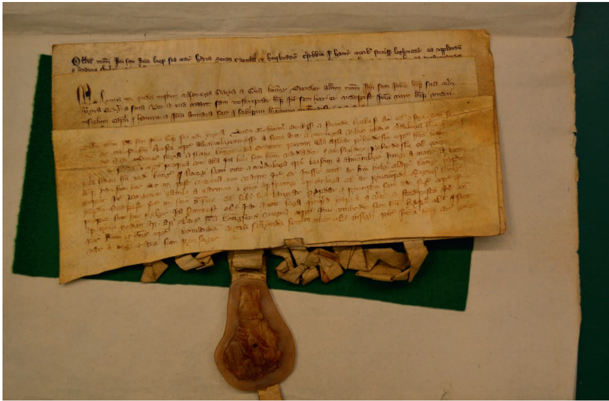
Figur 3: Dei tre samanhefte breva frå 1333, 1334 og 1344. Restane av seglet til kong Magnus Eriksson heng under brevet frå 1334, medan berre seglreimane er bevarte frå dei andre segla som tidlegare hang ved dei ulike breva. Originalar i Riksarkivet, Oslo.

sagt å vera frå 1299, 1515 og 1546, men som alle har vist seg å vera falske. 10 Forfalsking av dokument for å opparbeida seg ulike rettar var slett ikkje eit ukjent fenomen i gammal tid. Det er lite eller ingenting av informasjon om korleis fisket gjekk føre seg, i dei eldste skriftlege kjeldene. I all hovudsak er det først frå slutten av 1500-talet, då vi får fyldigare kjeldetilfang, at vi har meir informasjon om korleis fisket gjekk føre seg, gjennom referat frå rettssaker og liknande.