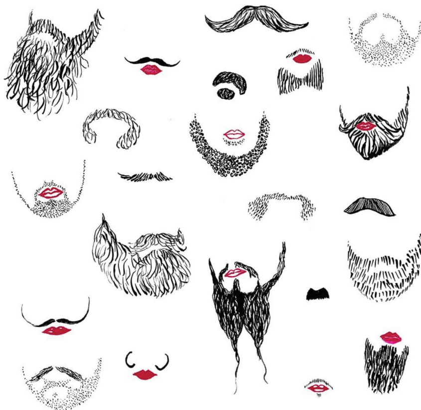
Figur 1. Mustasch- och skäggmodeller som deltagare fått välja mellan i performansprojektet Studio Vilgeförtis av H. Lunabba (2008-).

att namnet är inspirerat av helgonet St:a Wilgeförtis. Wilgeförtis korsfästes efter att hon bett om att få bli motbudande för att undvika äktenskap. Som svar på bönen växte ett skägg fram (Lunabba, u.å.a). Konstnären berättar att trots att helgonlegenden handlar om att göras ”motbudande” handlar projektet ”om att ge en möjlighet att stiga över en av de gränser som könsnormerna skapar” (H. Lunabba, personlig kommunikation, 22 februari, 2024). Lunabba påpekar också att ”både deltagare och publik har uppfattat skäggen som tilltalande snarare än motbudande” och att känslan av empowerment ligger i att ”stiga över könsnormernas gränser, att låta sig avporträtteras med skägg och att efter det röra sig i det offentliga rummet med skägget” (H. Lunabba, personlig kommunikation, 22 februari, 2024).