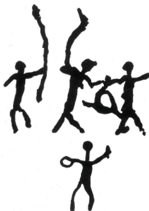
Figur 2. Sjaman med tromme. Helleristning fra Alta (Helskog, 1988, s. 53). Gjengitt med tillatelse fra Helskog. Lisens: CC BY-ND.

Figuren er datert til mellom 4000 og 4800 f.Kr. Foran en gruppe jegere med et bytte står det som trolig er en sjaman med ei tromme i handa. Helskog skriver om denne figuren: «Bak går det et menneske som synes å holde ei tromme i den ene og en slagstokk i den andre handa. Kanskje er det en sjaman som utfører et rituale» (Helskog, 1988, s. 53). Sjamanen står med ansiktet vendt mot jegerne (fordi vedkommende mest sannsynlig er høyrehendt), med utstrakte armer. Posisjonen og gestene kan tolkes som at sjamanen på en måte omslutter jegerne i bevisstheta si. Figuren tyder på at sjamanen må ha hatt en viktig betydning for jakta. Vi må anta at ritualene ikke bare var for at den enkelte jeger skulle lykkes, men et ønske om at «jaktbyttet skulle finnas tillgängligt för alla», og at «Riter, där flera människor deltog, innebar också att gruppens gemenskap både inåt och utåt stärktes» (Westman, 2006, s. 50). Likevel synes figuren også å fortelle at det var skilt ut en samfunnsmessig rolle som hadde en åndelig funksjon i tillegg til den rollen jegerne hadde i den praktiske jakta. Kanskje har det vært en person som har veiledet eller beskyttet jegerne på jakt, kanskje var sjamanen der for å gjenopprette en balanse i naturen?