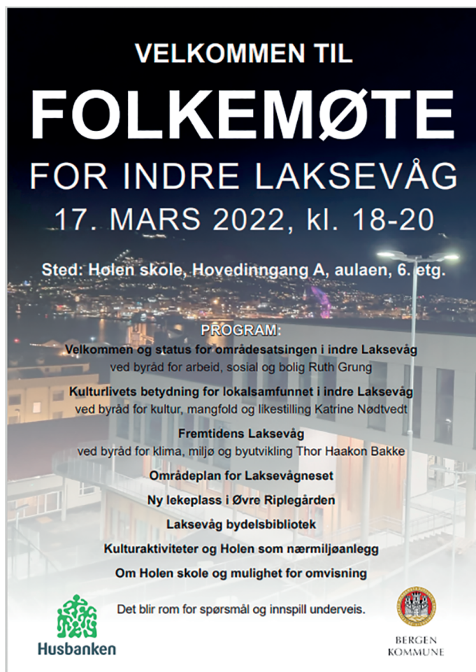
Figur 11.2 Eksempel på invitasjon til folkemøte i indre Laksevåg mars 2022. Plakat: Torben Blindheim, foto: Linda Nordgreen

Befaringer er en annen metode i verktøykassen. Befaringer skjer i samarbeid med en eller flere fagavdelinger i kommunene og representanter fra lokalbefolkningen. Eksempler på dette har vært i forbindelse med oppgraderingen av Sætreparken i Ytre Arna og etableringen av Håsteinarparken i indre Laksevåg. Poenget med befaringene er at fagfolkene skal dele sin kunnskap med beboere og at lokalbefolkningen får mulighet til å løfte sine behov. Det har også vært eksempler på at fag og interesser i lokalmiljøet kan være uforenelig.