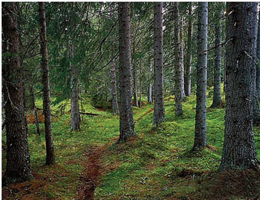
Figur 2. Det mest føretrekte sti- og skogmiljøet (foto: Vegard Gundersen).

Naturtypen i norske nærmiljø er i hovudsak skog – og ofte barskog. Altså går stiane for nærturen mest i skog. Kva kjenneteiknar ein triveleg sti og eit triveleg skogmiljø? Sjølv sagt avhengig av kven ein spør, men det er (eller det var?) også dominerande mønster. Aasetre spurde om føretrekte miljøkvalitetar blant turgåarar i Oslo og Skien alt tidleg på 1990-talet, og det å «gå på en enkel skogsti» kom klart best ut; omlag 70 % sa det var svært positivt (Aasetre, 1995). Seinare vart temaet studert vha. 15 foto av ulike infrastruktur i ulike skogmiljø, som gjekk til eit tilfeldig utval vaksne innbyggjarar på Austlandet og i Trøndelag (Gundersen & Vistad, 2016). Det biletet som var mest populært (snitt på 5,63 av maks. 7), såg slik ut (figur 2):