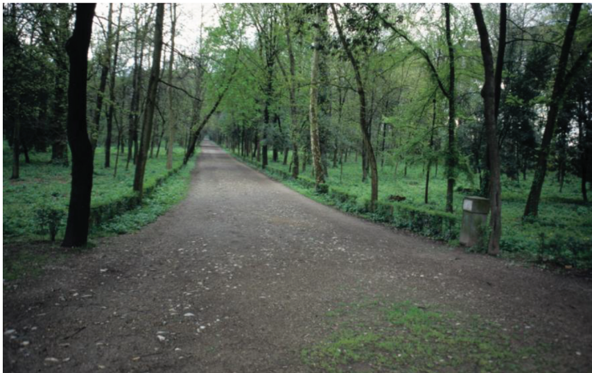
Figur 3. Dei to minst føretrekte sti/turveg- og skogmiljøa (foto: Vegard Gundersen).

I det fyrste ser me ein tettare skog, med lite vegetasjon i skogbotn og ein bordgang til å gå på, sikkert fordi skogbotn er fuktig og lett blir gjørmete og opptrakka av ferdsl (snittskåre 3,63). Slik plankelegging er, som sagt, eit