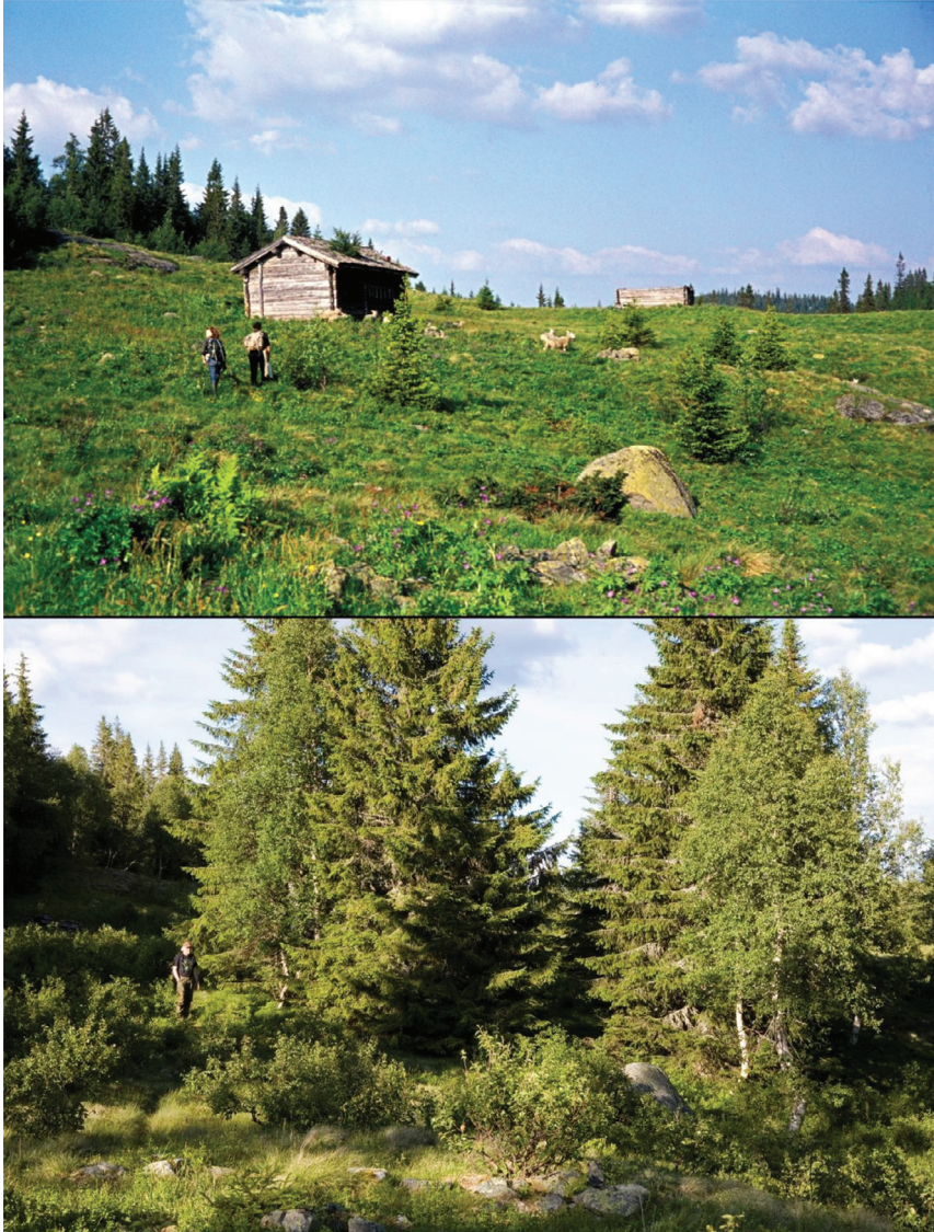
Figur 1. To bilete av Herrvasstøylen, tatt frå same punkt. Øvst 1972, nedst 2008.

nøysame og vanlegaste graset i desse heitraktene i indre Telemark. Finnskjegg invaderer stien ganske fort, og det blir vanskeleg å skilje om det er ein folkesti eller eit dyretrakk som gror til; altså kan ein kome 'på villstrå' (dvs. 'på ville veier', ifylgje ordboka). Me spør av og til: Skal du den vegen eller den vegen? Og me meiner ikkje ein fysisk veg til å gå på,