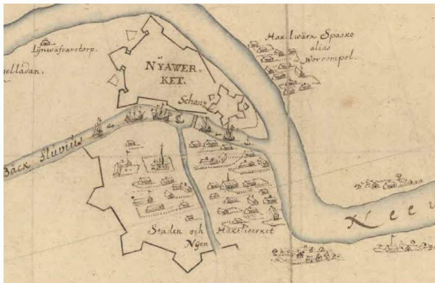
Nyen och Nyenskans. Både den svenska och tyska kyrkan är tydligt synliga. Nord till höger i bilden. Delförstoring av Erik Dahlbergs karta över Nevan, 1681.