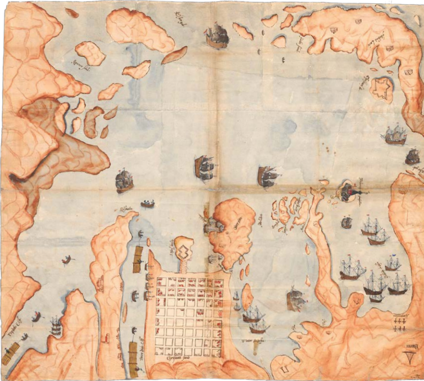
Kristiansand 1662.

enn Fredriksholm, men en høyere offiser enn kaptein. Gjennom 1700-tallet var kommandantene på Fredriksholm kapteiner og majorer. Kommandantene i Kristiansand var oberster og generalmajorer. 42 Kristiansand og Fredriksholm var sentrum for kystforsvaret i hele stiftet. I ufredstider var det også landmilitære styrker i området.